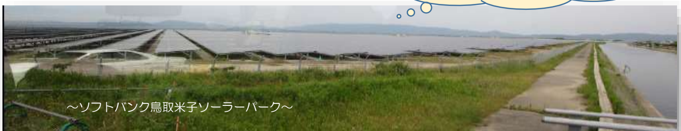
～ソフトバンク鳥取米子ソーラーパーク～