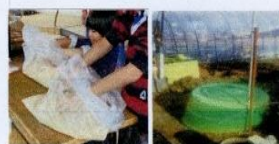
ボカシづくり コンポストで生ごみ処理